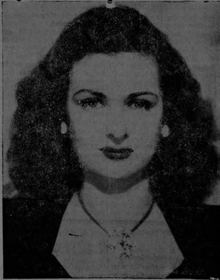
El maquillaje de la adorable Joan Bennet siempre está de acuerdo con el carácter de las escenas en que la actriz se presenta, afirma el estilista de Hollywood Max Factor Jr.

res se refieren especialmente a las novias. Sin embargo; el principio básico de todas ellas puede ser aplicado a todas las mujeres. Es decir, que todas deben maquillarse de acuerdo con las circunstancias para estar siempre "en carácter". El color de los cosméticos que usa